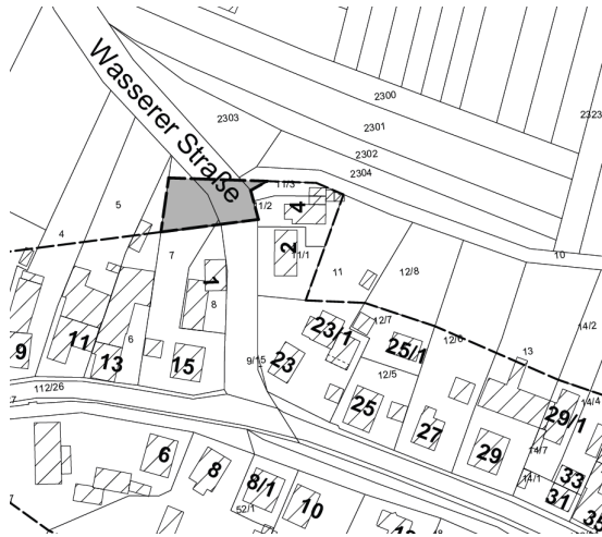
Darstellung der Einbeziehungsfläche 2 in grau, ohne Maßstab