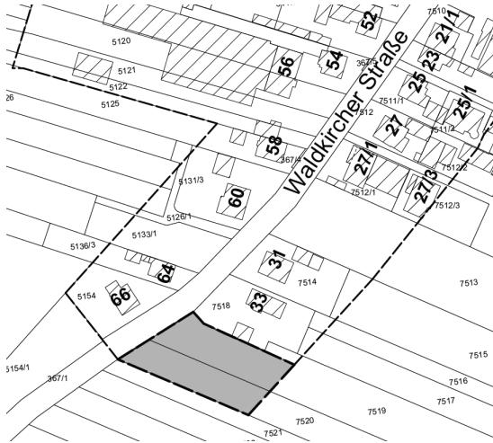
Darstellung der Einbeziehungsfläche 1 in grau, ohne Maßstab