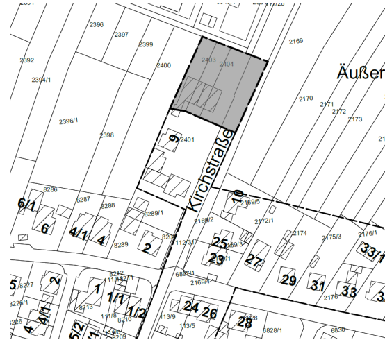
Darstellung der Einbeziehungsfläche 4 in grau, ohne Maßstab

Der Entwurf der „Einbeziehungsatzung“ wird mit Begründung und Umweltbeitrag