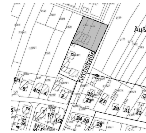
Darstellung der Einbeziehungsfläche 4 in grau, ohne Maßstab

naue Abgrenzung der vier Flächen ergibt sich aus den nebenstehenden Lageplänen. Der Entwurf der „Einbeziehungssatzung“ wird mit Begründung und Umweltbeitrag