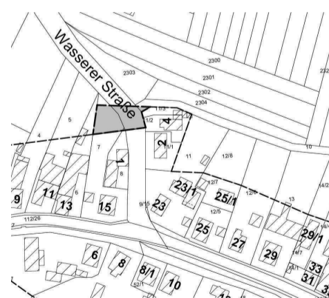
Darstellung der Einbeziehungsfläche 2 in grau, ohne Maßstab

Lage des Plangebiets Das Plangebiet hat eine Größe von insgesamt ca. 4.620 m 2 , verteilt auf vier Teilflächen. Sie befinden sich innerhalb der Gemeinde Denzlingen. Eine ge-