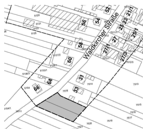
Darstellung der Einbeziehungsfläche 1 in grau, ohne Maßstab

des Innenbereichs zur Ausschöpfung von Wohnflächenpotentialen erfolgen und somit ein Beitrag im Hinblick auf die angespannte Wohnungsmarktsituation geleistet werden.