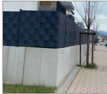
Beispiel für eine „tote“ Einfriedung.

Falls Sie weitere Fragen haben oder eine rechtliche Beratung wünschen, können Sie sich gerne an das Verbandsbauamt des Gemeindeverwaltungsverbandes Denzlingen-Vörstetten-Reute, Frau Jurzinski (Telefon 07666 / 611-1722, E-Mail: n.jurzinski@denzlingen.de ), wenden.