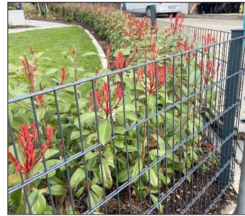
Beispiel für eine „kombinierte“ Einfriedung.