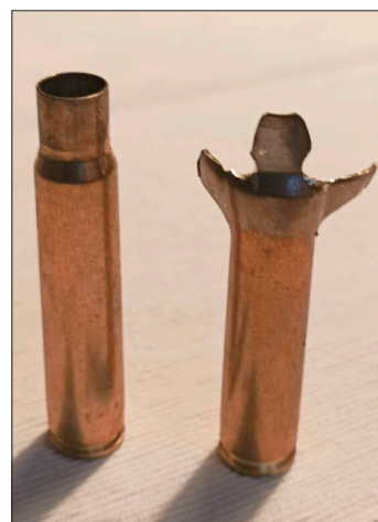
Friedenssymbol pur: Eine Patronenhülse als Friedensengel gestaltet.

Denzlingen (hg). Auch diesmal wurden in Denzlingen drei Outdoorfeiern zu „Heiligabend 17 Uhr“ trotz stürmischer Winde gerne angenommen. So seien etwa 300 Menschen - vom Kleinkind bis zum Großvater - der Einladung gefolgt, Heiligabend entweder beim Franziskuskindergarten, bei der Mediathek oder am Heimethues miteinander zu feiern.