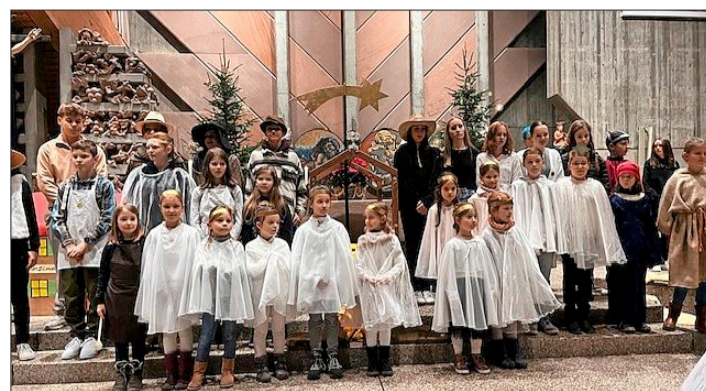
Bei der Krippenfeier mit dem Ökumenischen Kinder- und Jugendchor in St. Jakobus.

Denzlingen. „Gemeinsam für unsere Erde - in Amazonien und weltweit!“ Unter diesem Motto besuchen die Sternsinger im Rahmen des Dreikönigssingens 2024 Häuser und Wohnungen. Die Kinder und Jugendlichen bitten um Spenden für Kinderhilfsprojekte in Afrika, Asien, Lateinamerika, Ozeanien und Osteuropa. Im Denzlinger Rathaus empfing Bürgermeister Markus Hollemann die „Heiligen drei Könige“ aus der Seelsorgeeinheit An der Glotter. Im Mittelpunkt des Besuchs standen die Bewahrung der Schöpfung und der respektvolle Umgang mit Mensch und Natur. Der Rathauschef bedankte sich bei den „Weisen aus dem Morgenland“ für ihr Engagement für Menschen in Not: „Danke, dass ihr euch in euren Ferien für andere Menschen stark macht.“ Die Sternsinger überbrachten Segenswünsche für das Rathaus sowie für alle, die dort ein- und ausgehen und zogen nach einer Stärkung mit einer Spende weiter. Weitere Infos unter: https://www.sternsinger.de/