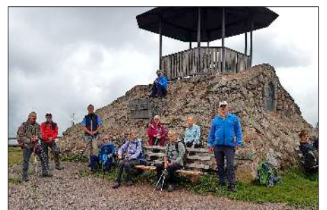
Die erste Wanderung des Schwarzwaldvereins Denzlingen nach der Corona-Zwangs-pause führte auf den Kandel.

Fazit: Trotz des verregneten Samstags begaben sich 10 Wanderbegeisterte auf die anspruchsvolle Tour und der Wettergott war gütig gestimmt. Die Teilnehmer waren achtsam und haben auf die Abstände beim Wandern, Rasten und im Bus geachtet. Diese Verhaltensregeln sollen zwar nicht dauerhaft zur „neuen Normalität“ werden, aber dennoch hat die Bewegung in der schönen Natur und die wieder möglichen Begegnungen die Herzen höher schlagen lassen.