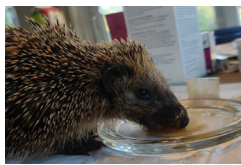
Igel mit Hungerknick im Nacken