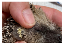
Igel mit Fliegeneier, hier zählt jede Minute !