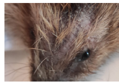
Igel mit Hautmilben